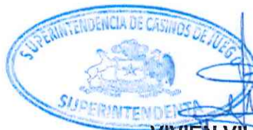
VIVIÉN VILLAGRÁN ACUÑA SUPERINTENDENTA DE CASINOS DE JUEGO